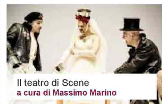
Il teatro di Scene a cura di Massimo Marino