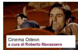
Cinema Odeon a cura di Roberto Manassero