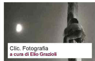
Clic. Fotografia a cura di Elio Grazioli