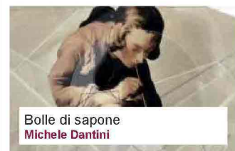
Bolle di sapone Michele Dantini