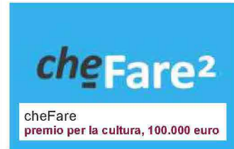
cheFare premio per la cultura, 100.000 euro