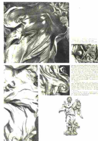
PAGINA DELLA RIVISTA "SPAZIO", N. 2, AGOSTO 1950 ANALISI DEL DRAPPEGGIO DELL'ANGELO PORTANTE LA CORONA DI SPINE DI GIAN LORENZO BERNINI NELLA CHIESA DI SANT'ANDREA DELLE FRATTE, ROMA