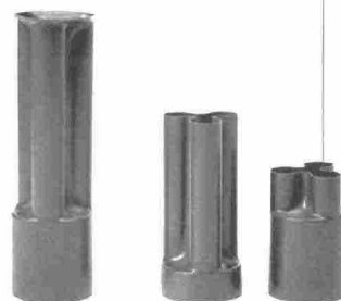
ENZO MARI, VASI DELLA SERIE TRIFOGLIO, DANESE 1969